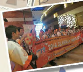
ASPAC Hong Kong, after our bidding