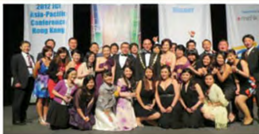
ASPAC Hong Kong, Gala with JCI City Lady