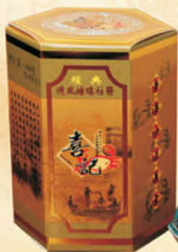
喜記避風塘瑶柱醬