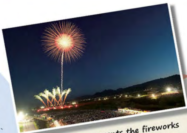
"JCI Yamagata presents the fireworks of Yamagata city"